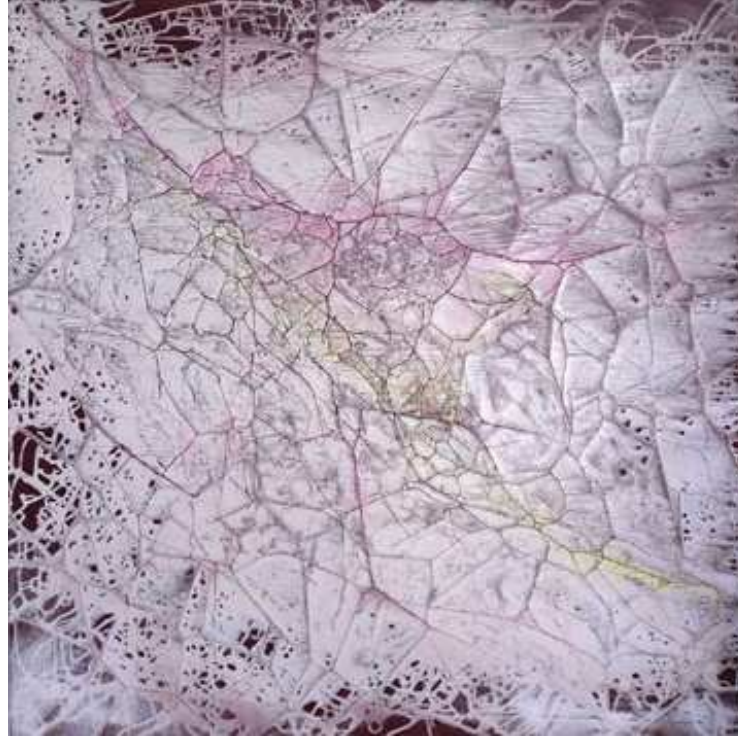
s/t, 2013. (Serie Al borde del caos) Acrílico sobre tela. 156 x 154 cm.