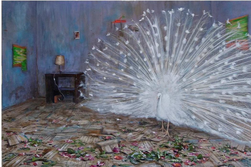
Pavo real, 2013.

Óleo sobre C- print (Impresión fotográfica sobre tablex) 50 x 73 cm.