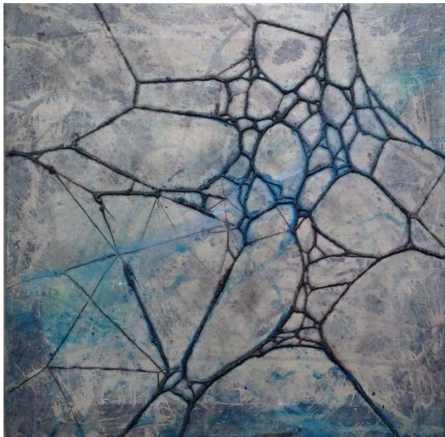
s/t, 2013. (Serie Al borde del caos) Acrílico sobre tela. 48 x 49 cm.