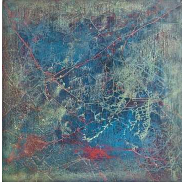
Viaje al mar abierto, 2013. (Serie Al borde del caos) Acrílico sobre tela. 152 x 156 cm.