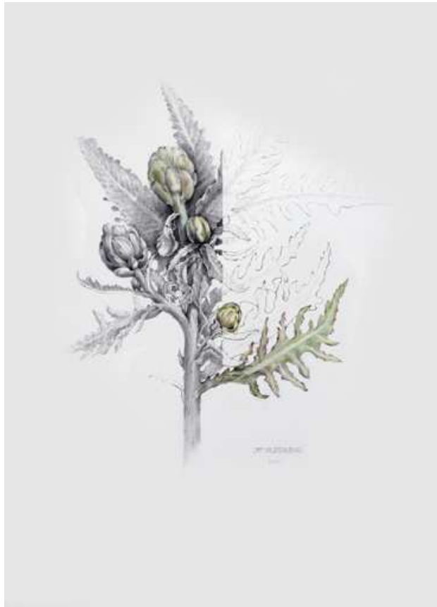
Josep Ma Vilarrubias Carxofera , 2011. Llapis i aquarel·la sobre paper. 70 x 50 cm.