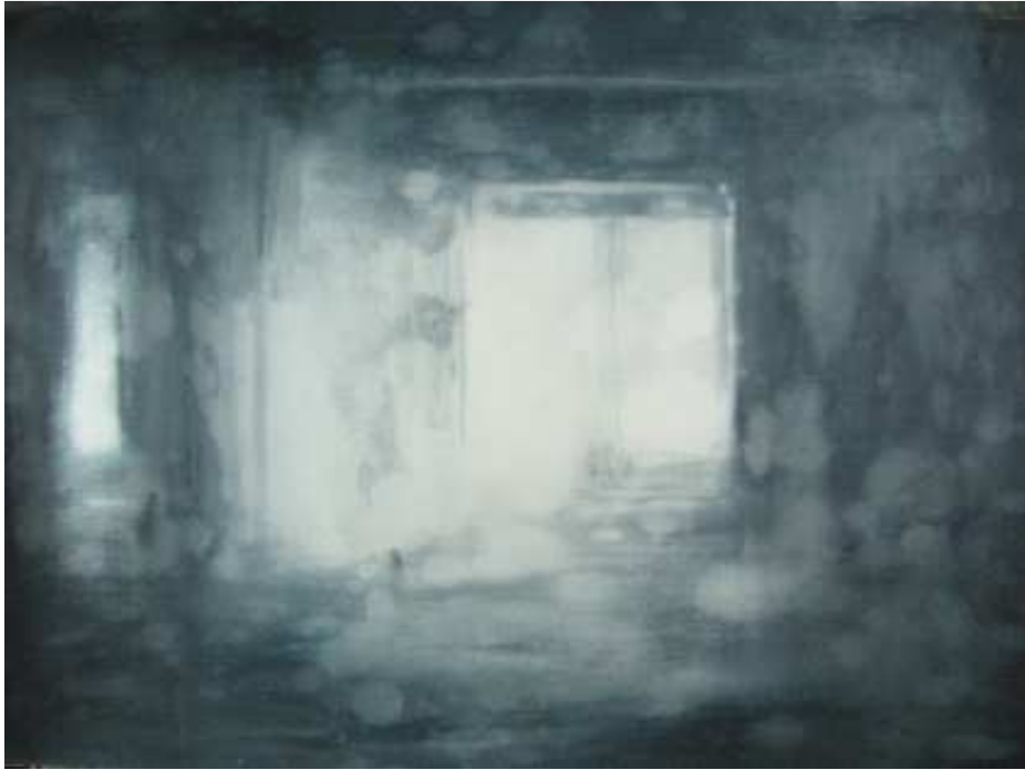
Eduard Resbier Estancia, 2010. Tinta sobre paper. 59 x 76 cm.