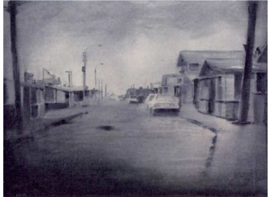
Eduard Resbier Puerto Williams , 2012. Tinta sobre paper. 56 x 76 cm.