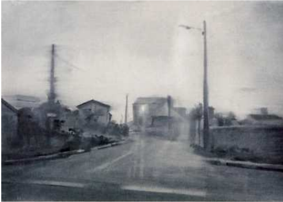
Eduard Resbier Finisterra , 2012. Tinta sobre paper. 56 x 76 cm.