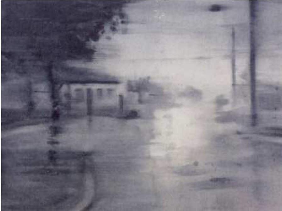
Eduard Resbier Lluvia, 2010. Tinta sobre paper. 56 x 76 cm.