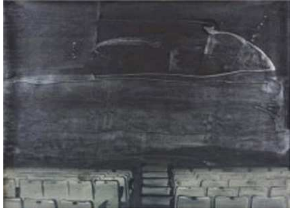
Eduard Resbier Meloqueas, 2012. Tinta sobre paper. 56 x 76 cm.