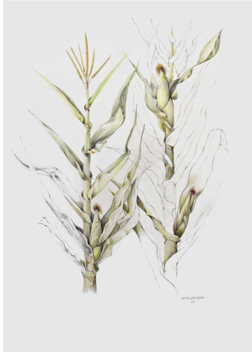
Josep Ma Vilarrubias Blat de moro , 2011. Llapis i aquarel·la sobre paper. 100 x 70 cm.