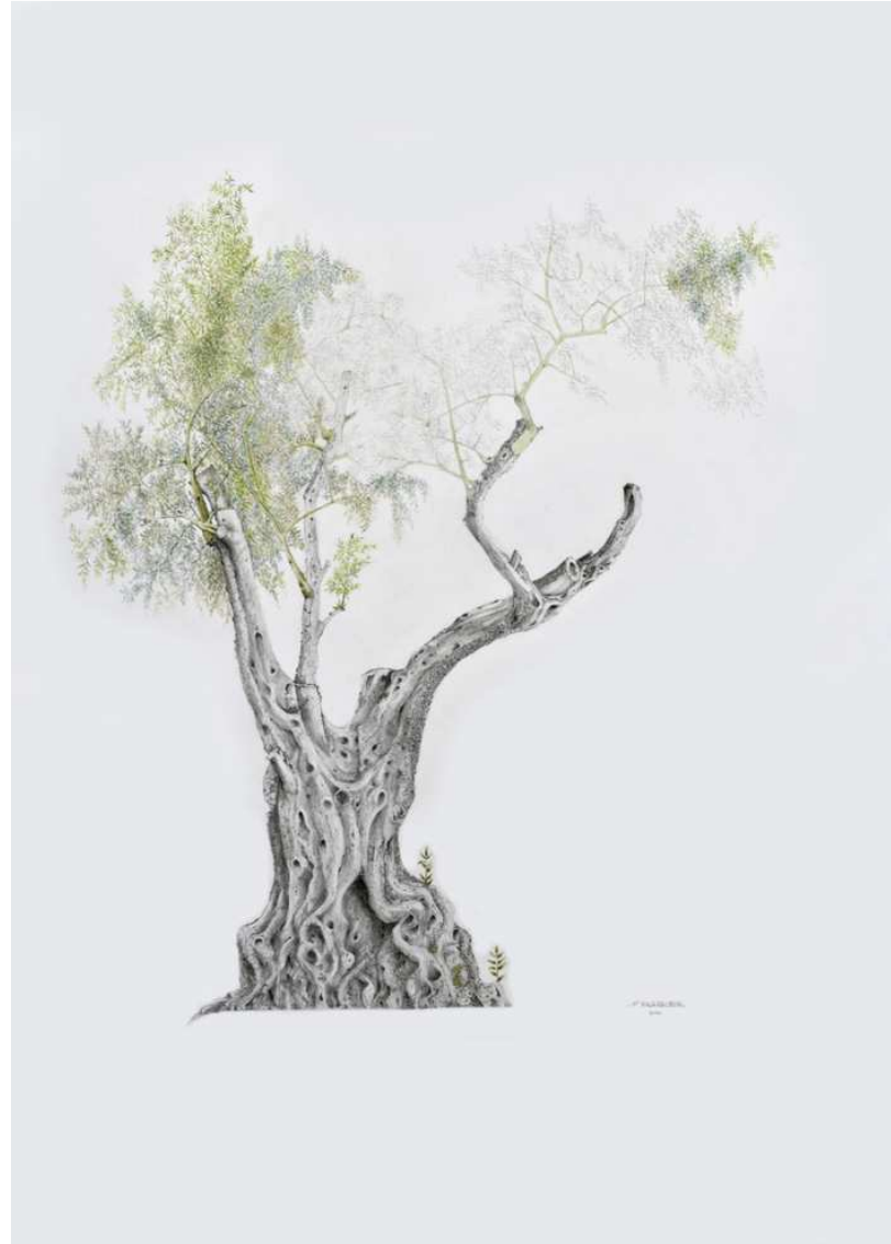
Josep Ma Vilarrubias L'olivera de Can Gascons, 2011. Llapis i aquarel·la sobre paper. 100 x 70 cm.