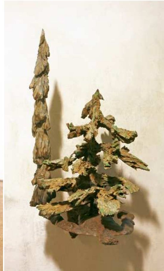
Mirador de adentro Ferro colat i fusta d' alber. 64 x 30 x 33 cm.