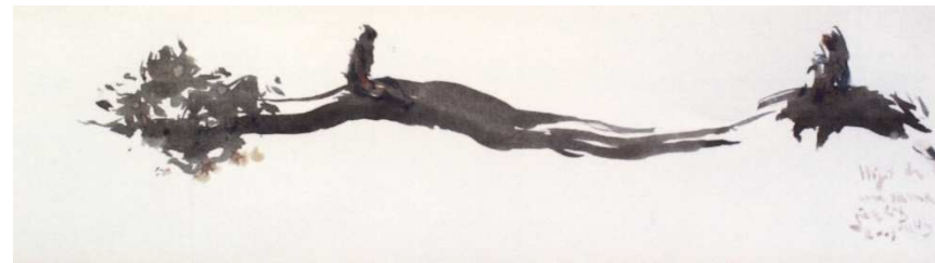
Mirador de Claudio.