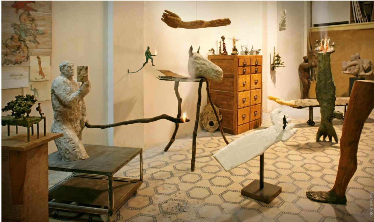
Jaume de Córdoba. Escultures i dibuixos.