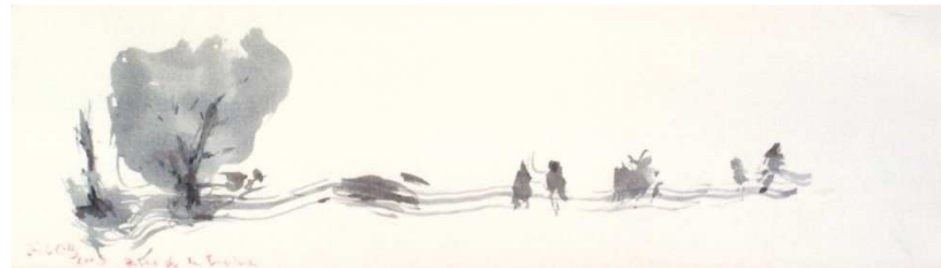
¡Qué lejos estás!