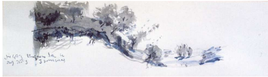
Terra d' arboç.