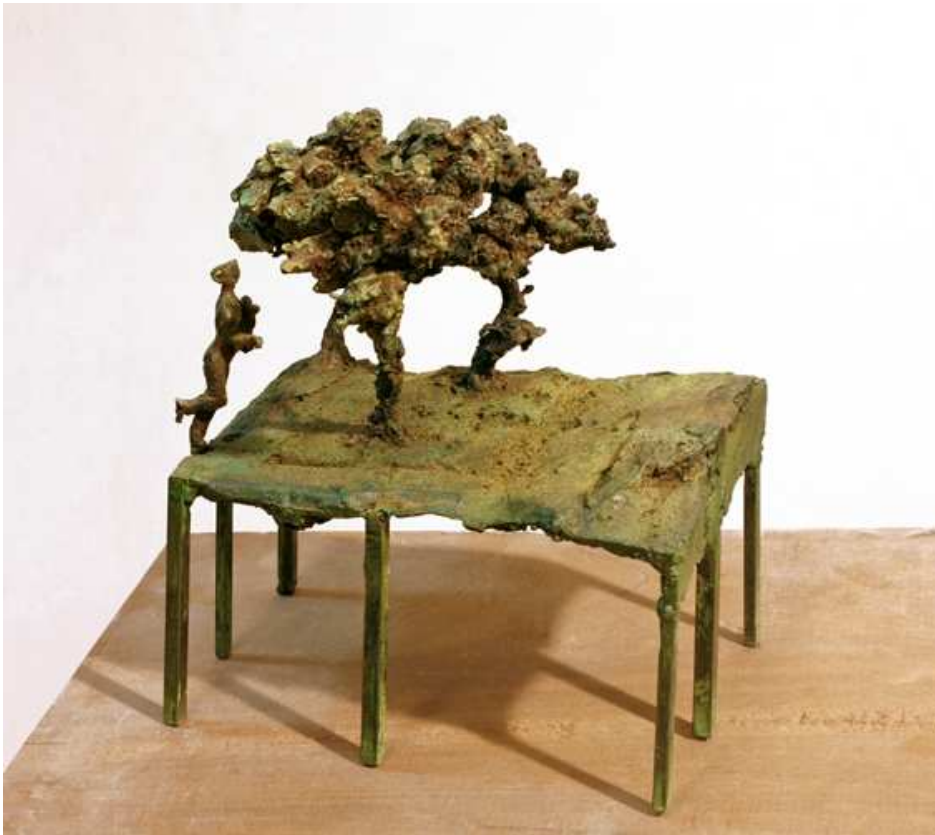
El bosque de Júlia Ferro colat . 26 x 26 x 29 cm.